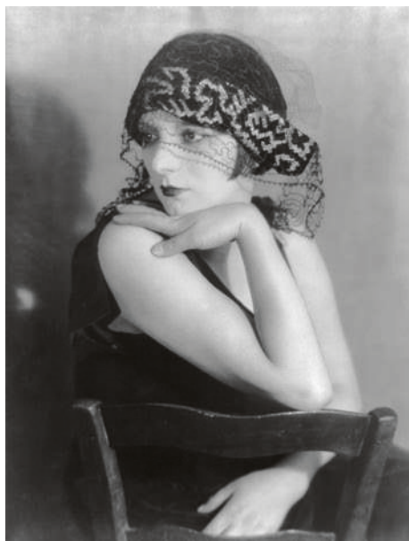
Kiki de Montparnasse