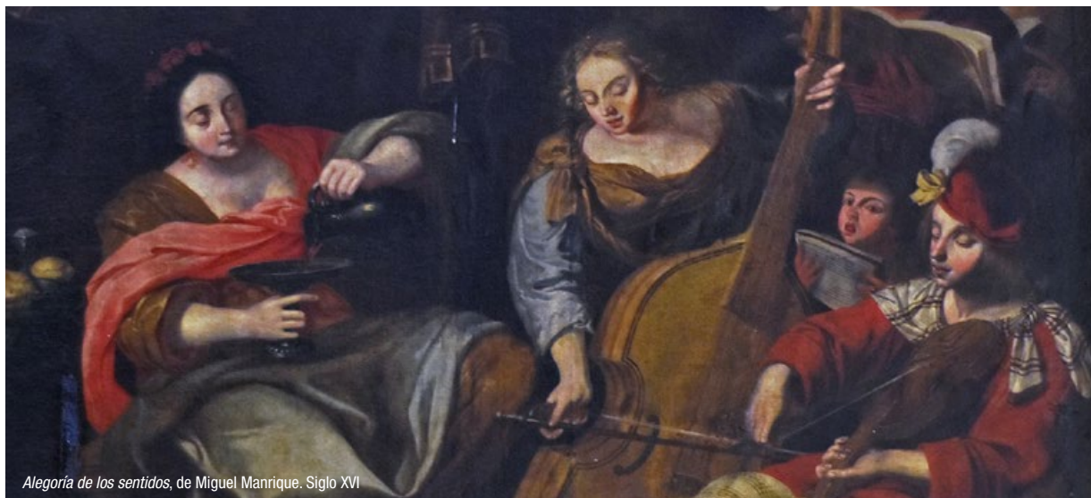
Alegoría de los sentidos, de Miguel Manrique. Siglo XVI